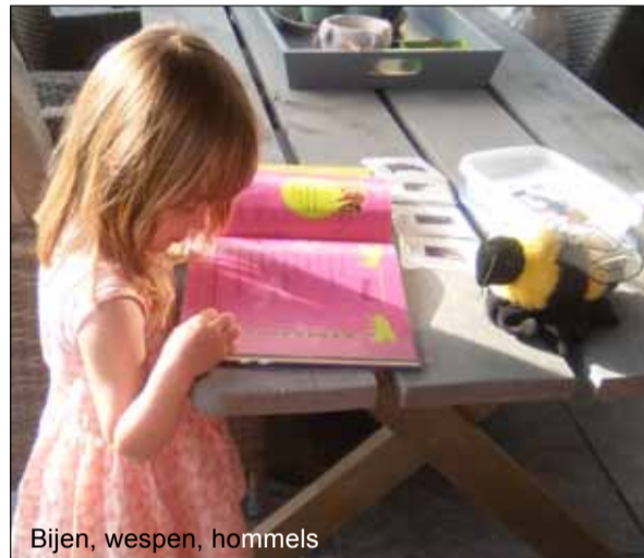
Bijen, wespen, hommels